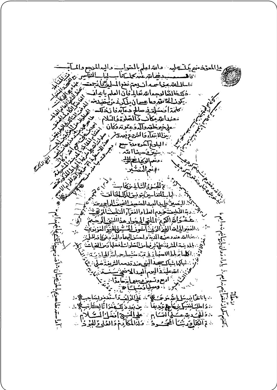
صورة اللوحة الأخيرة من الجزء الثاني من النسخة الخطية من مكتبة نور بانو والمرموز لها بـ (ن)